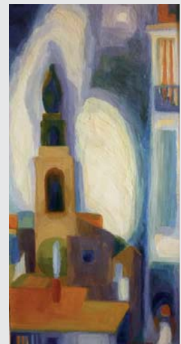
Le clocher de Sète , 1961, 80x40

Vente le samedi 27 octobre : à partir de 10h au Théâtre Molière, Sète