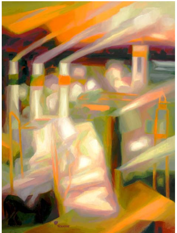
Printemps, fumée d'usine, 1979, 130x97

Pour Richarme, l'œil note, le cerveau enregistre, l'esprit construit. Puis vient le temps de la méditation devant la toile : alors le réel, même prosaïque, devient œuvre d'art habitée par sa vision intérieure.