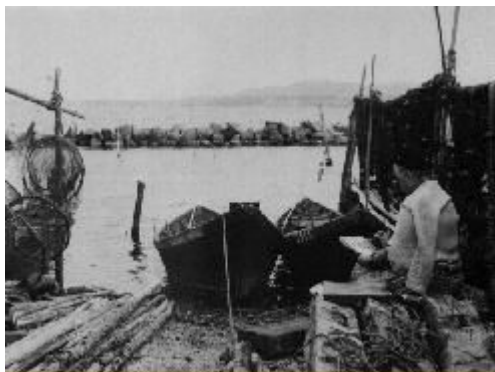
Richarme à la Pointe Courte, 1957

En réalisant ce livre, j'ai eu envie de répondre à ses hésitations, sans la trahir :