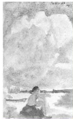
Nuage, Palavas 1949 21 X 13,5 cm

Ou par internet : www.jeanne-laffitte.com